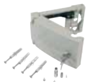
Kit di sblocco esterno con 4 m di cavo metallico

External release kit with 4 m metallic wire